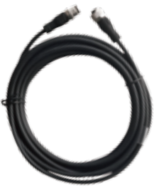
网关与读写器连接线