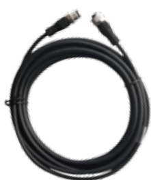
网关与读写器连接线